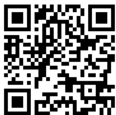
エクストリーム 公式サイト